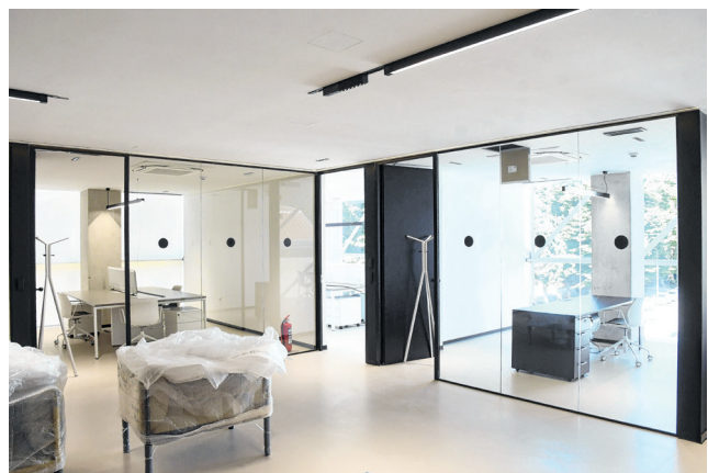
Nužni »prostori za privatnost« služe da se korisnici mogu izolirati kada imaju poslovne ili privatne telefonske razgovore

- No, isto tako želimo stvoriti novu vrstu poduzetničke zajednice, a osim klasičnih malih i srednjih poduzetnika, centar će biti na usluzi i tzv. »freelancerima«, odnosno slobodnim profesionalcima, digitalnim nomadima, akterima u brzorastućoj kreativnoj industriji te svim ostalim zainteresiranim poduzetnicima, kazao nam je Boris Sabatti.