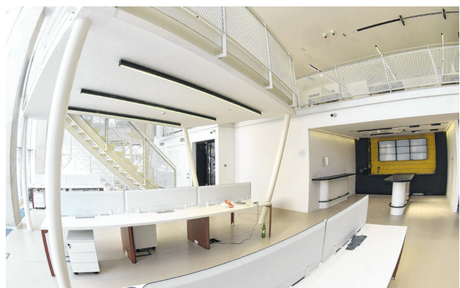
U prizemlju se nalaze i ormarići za pohranu stvari, recepcija za prijavu, te kuhinja prostor za druženje i umrežavanje

potreba. Na katu se nalazi i »prostor za opuštanje« u kojem se nalaze stolni nogomet, pikado, te popularni PlayStation kao provjereno i definitivno jedno od najučinkovitijih sredstava za opuštanje kad su u pitanju pripadnici mlađih generacija. Na ovoj etaži nalaze se i nužni »prostori za privatnost« u kojima se korisnici mogu izolirati u slučaju kad imaju poslovne ili privatne telefonske razgovore kojima ne žele ometati ostale koji u tom trenutku borave i koriste zajedničke radne prostore, a tu su i dvije mekukatne platforme s radnim mjestima i foteljama za odmor i opuštanje.