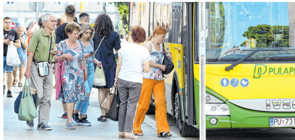
Novi zimski red vožnje počinje danas

Linija 5a (Giradini - Štinjan - Puntizela - Štinjan - Giardini) postaje linija 5 (Giardini - Štinjan - Giardini)