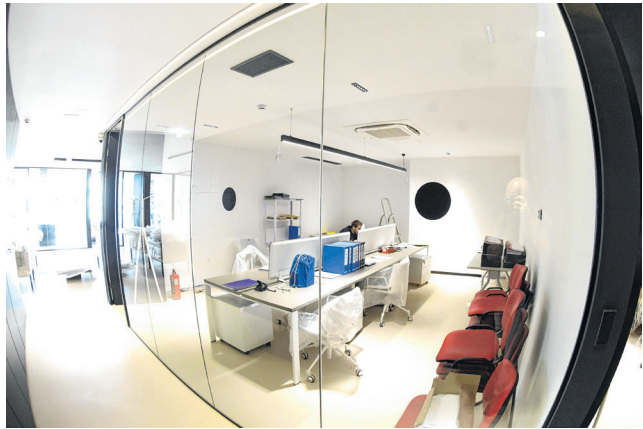
Istovremeno prostore može koristiti oko stotinjak korisnika ako se za time ukaže potreba