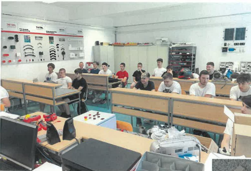
U projektu je sudjelovalo 15-ak učenika